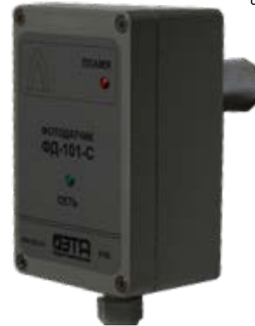
Рис.1 Общий вид прибора

4.6. На корпусе расположен светодиодный индикатор ПЛАМЯ, сигнализирующий о наличии пламени, и индикатор напряжения питания СЕТЬ.